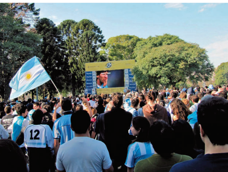
► Hinchas argentinos mirando la Copa Mundial de Fútbol. Los eventos deportivos internacionales fomentan el sentimiento de pertenencia a una nación.

La organización jurídica está plasmada, en general, en una Constitución, ley fundamental que determina cómo será la forma de gobierno del Estado y cuáles son los derechos y obligaciones de sus ciudadanos. Las Constituciones se pueden reformar, para adaptarlas a los cambios que se producen en las sociedades. En la Argentina, la reforma constitucional de 1994 incorporó, por ejemplo, el reconocimiento de los derechos de los pueblos aborígenes y el derecho de todos los ciudadanos a vivir en un ambiente sano, dos cuestiones que no existían como preocupaciones al sancionarse la primera Constitución en 1853.