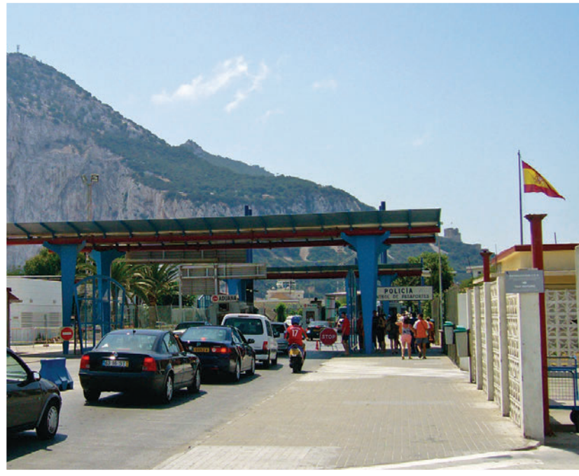
► Paso de frontera entre España y Gibraltar.

El espacio aéreo se ubica sobre el Mar Territorial y el espacio terrestre. En cuanto a su límite superior, aún no se ha llegado a un acuerdo internacional, pero el criterio más aceptado en la actualidad es que a 100 km de altura finaliza el espacio aéreo controlado por el Estado y comienza el espacio exterior o cósmico, que es considerado internacional.