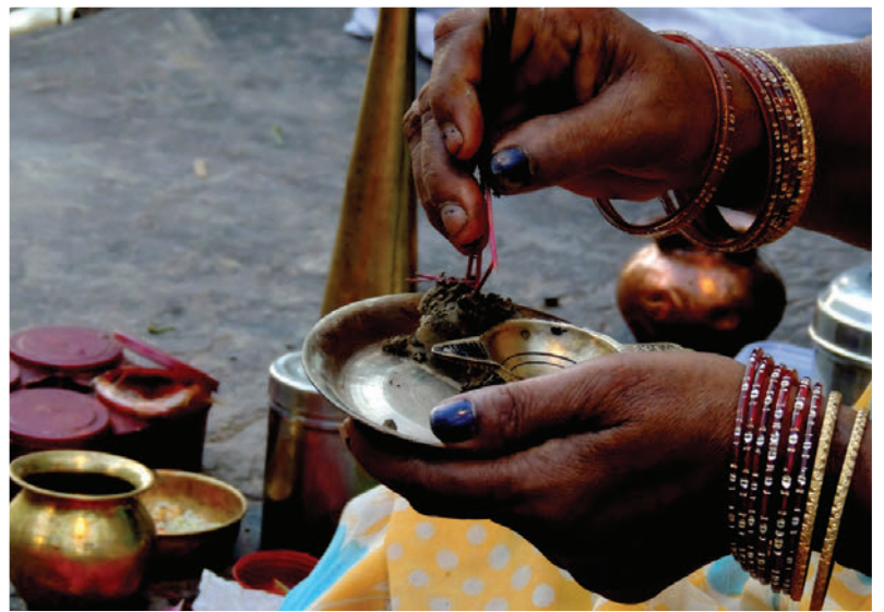
► Ceremonia hinduista a orillas del río Ganges. Los hindúes ofrendan flores u otros objetos a los dioses.

Ambos países, por razones distintas, son víctimas del terrorismo islámico, por lo que el interés de ambos gobiernos es encontrar alguna forma de colaboración, ausente hasta ahora.