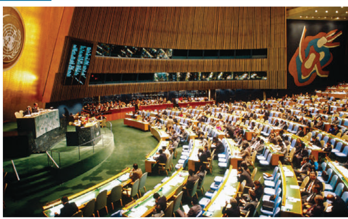
► Asamblea General de la ONU, Nueva York.

Preámbulo de la Carta de las Naciones Unidas.