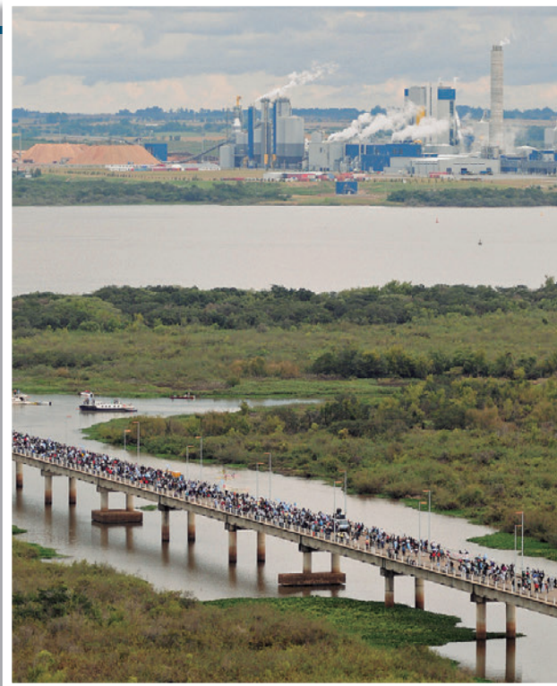
► Planta de celulosa de la empresa finlandesa Botnia, instalada a orillas del río Uruguay.

Por otro lado, se las acusa de promover la homogeneización cultural de las sociedades. A través de las publicidades, estas empresas impulsan hábitos de consumo que llegan a todo el mundo, creando así nuevas necesidades y deseos que generan consumidores de productos iguales, poniendo en riesgo la supervivencia de pautas culturales propias de cada lugar.